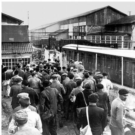
ouvriers d'usine, quartier Saint-Roch

cette occasion. C'étaient des fillettes de douze à quinze ans qui les constituaient et il fallait voir avec quelle ardeur elles conspuaient leurs patrons et patronnes... C'était plutôt pénible. »